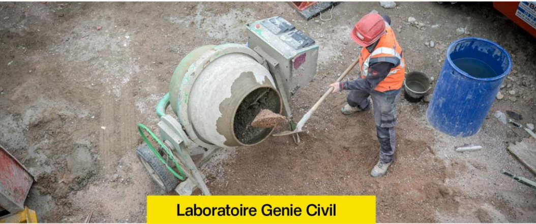
Laboratoire Genie Civil